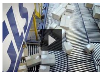
GLS Corporate film