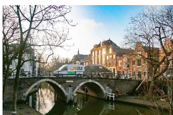
GLS-bestelwagen in Utrecht (Nederland)