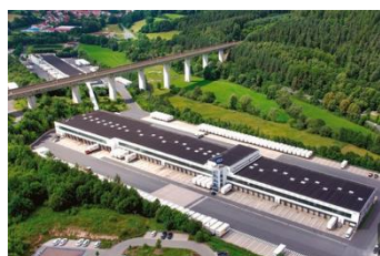
Europa-hub en Neuenstein (Duitsland)