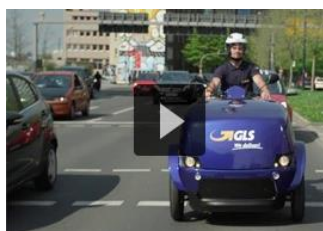
Elektrische mobiliteit bij GLS