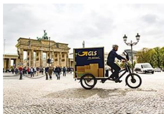
Levering via elektrische fiets