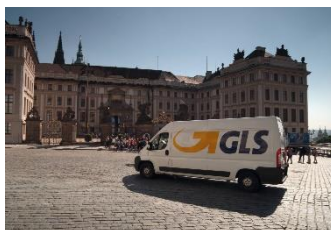
GLS-bestelwagen in Praag (Tsjechië)